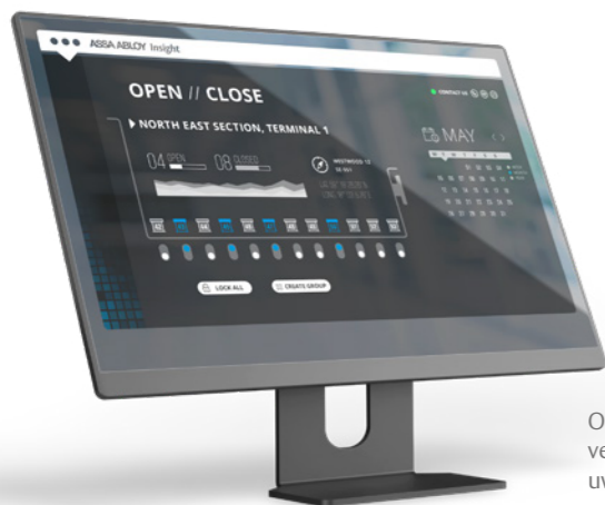
Open/sluit of vergrendel/ontgrendel uw deuren op afstand.