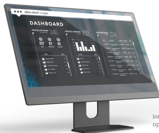
Intuïtieve interfaces op het Insight-platform

Scan voor meer informatie over ASSA ABLOY Service